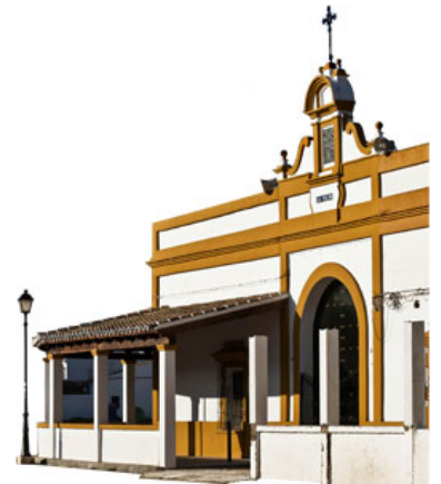
Andalucia Spagna L'altro volto di El Rocio